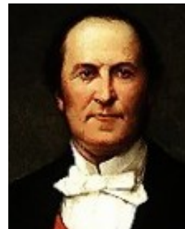
Le baron Haussmann 1809 - 1891