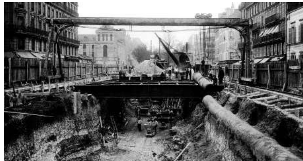
Construction du métro station rue de Rome en 1902