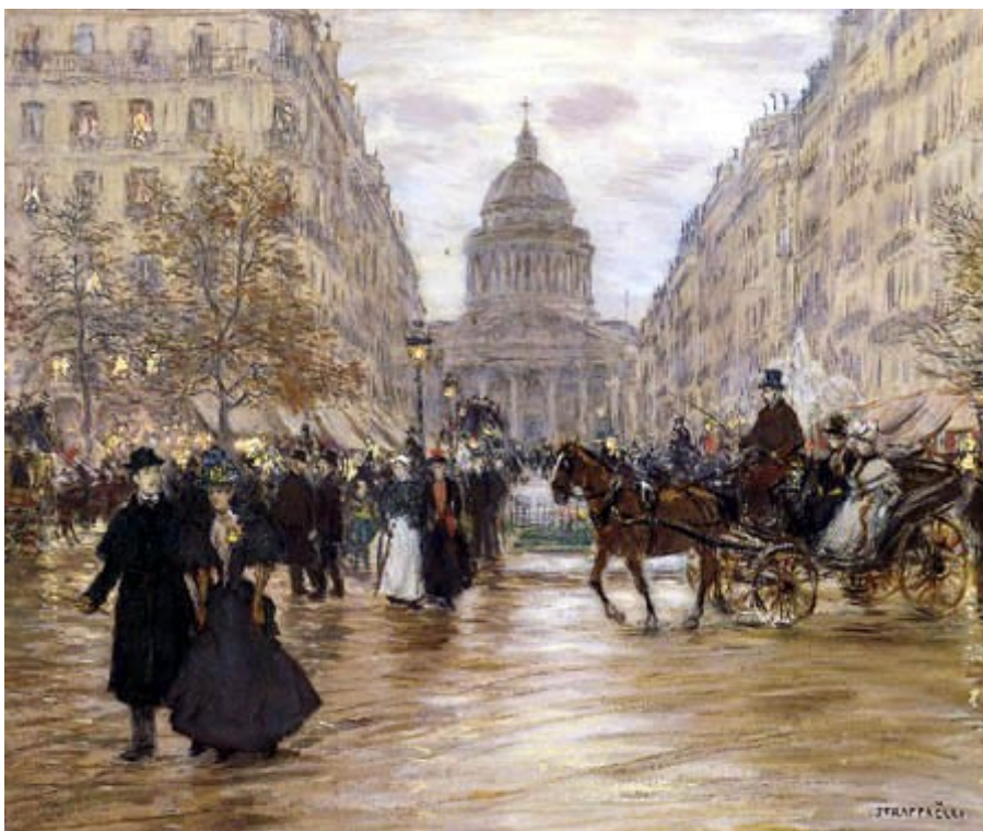
Boulevard Saint-Michel, Jean-François Raffaëlli, huile sur toile, 1918