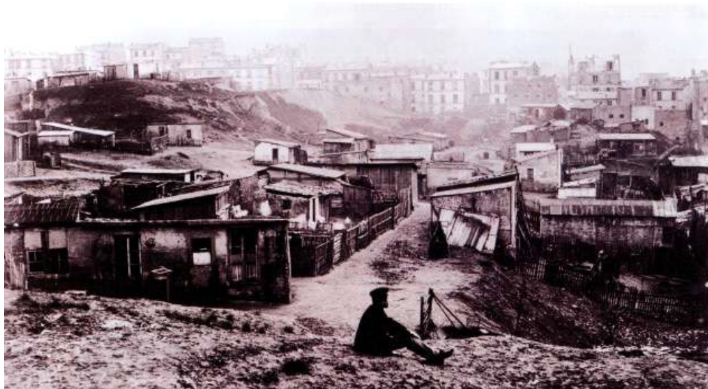
Une banlieue parisienne avec ses bidonvilles à la fin des années 1860