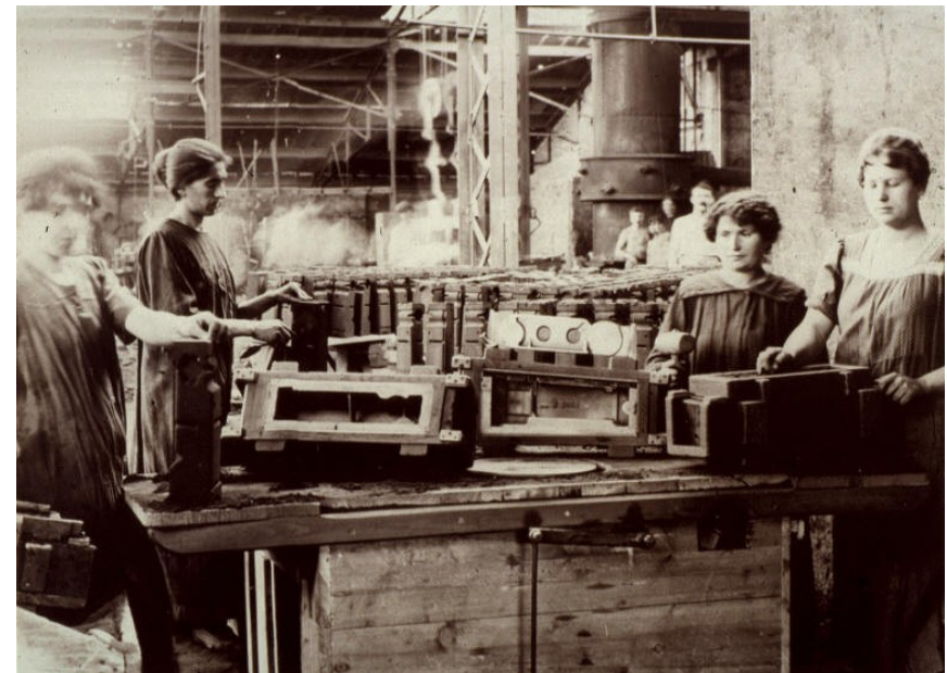
Travail des femmes dans une usine d'armement aux abattoirs de la Mouche à Gerland en 1914

L'instruction primaire est obligatoire pour les enfants des deux sexes âgés de six ans révolus à treize ans révolus ; elle peut être donnée soit dans les établissements d'instruction primaire ou secondaire, soit dans les écoles publiques ou libres, soit dans les familles, par le père de famille lui-même ou par toute personne qu'il aura choisie.