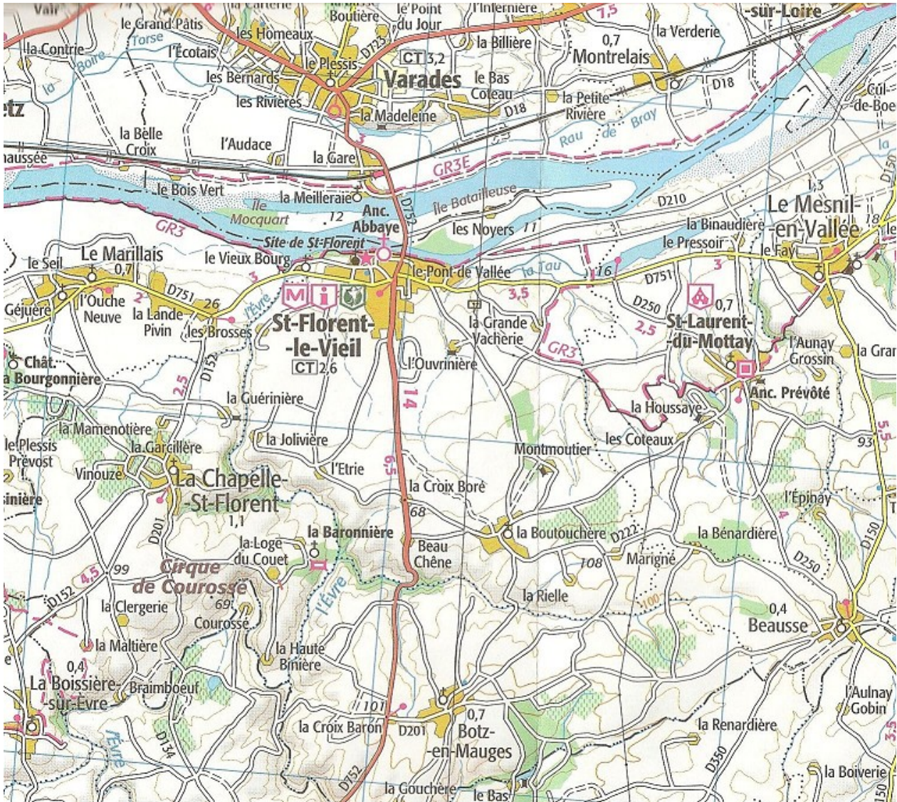
Détail de la carte IGN Top 100, Tourisme et découverte, Angers Laval